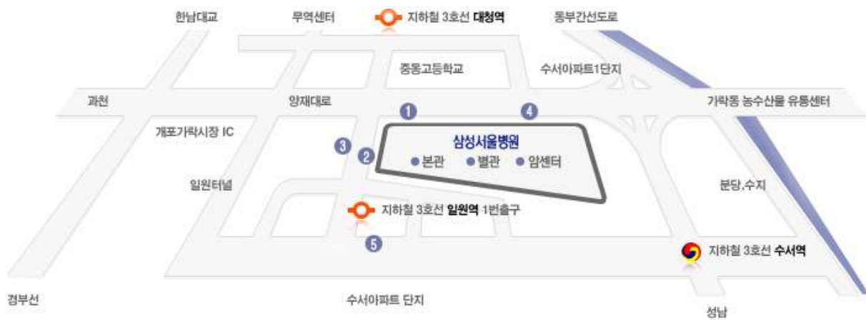
병원 주변 정류장 위치